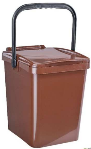
Contenitore da lt. 25